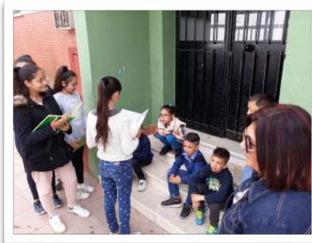
Apadrinamiento lector en la barriada