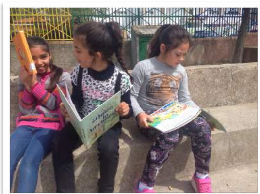
Lectura compartida en el patio de recreo

La participación de las familias no es todo lo frecuente que nos gustaría. Los compromisos de voluntariado de familias no se cumplen plenamente y eso nos impide tener una continuidad en las actuaciones educativas. Para el presente curso se tiene prevista la motivación para la participación en diversas comisiones. Contamos con la Fundación D. Bosco para la formación de familiares.