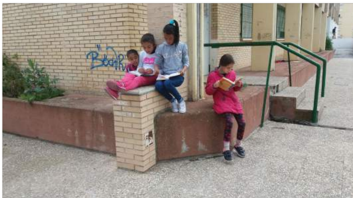
Lectura compartida en el tiempo de recreo

Cada comisión tiene asignadas unas funciones claras, delegadas y delimitadas que forman la estructura de trabajo anual.