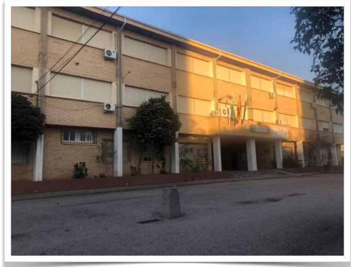
Fachada principal del Centro

En cuanto a alfabetización, los estudios recogen que las tasas de analfabetismo total y funcional se sitúan en torno al 25.8%. Con esto en vista, el planteamiento que hacemos desde el Centro educativo es poner en marcha actuaciones y metodologías que logren superar estas carencias. Según datos de la extinta AGAEVE, el ISC del Centro se sitúa muy por debajo de la media andaluza.