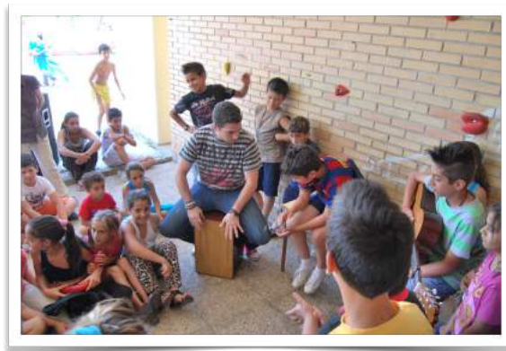
Participación de familiares y antiguo alumnado

Las tertulias literarias dialógicas quedaron implantadas como actividad educativa de éxito desde el año 2010, extendiéndose paulatinamente a los diversos cursos del Centro. Se realizan con una periodicidad quincenal, con la colaboración de la entidad Asociación Socioeducativa Poveda. Se ha usado siempre literatura clásica universal para trabajar, primero en clase y luego el día de la tertulia. Se trata de una experiencia muy enriquecedora donde se producen unas interacciones positivas con personas de diferentes edades, al mismo tiempo que se intercambian opiniones válidas que se defienden desde el respeto mutuo. Dentro del claustro se nombra a una persona coordinadora que se encarga de la selección de las lecturas semanales. Se hace entrega de las mismas al alumnado, profesorado y voluntariado para que las trabajen antes de realizar la tertulia.