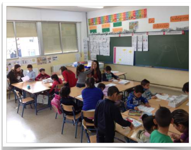
Grupo Interactivo en Primer Ciclo