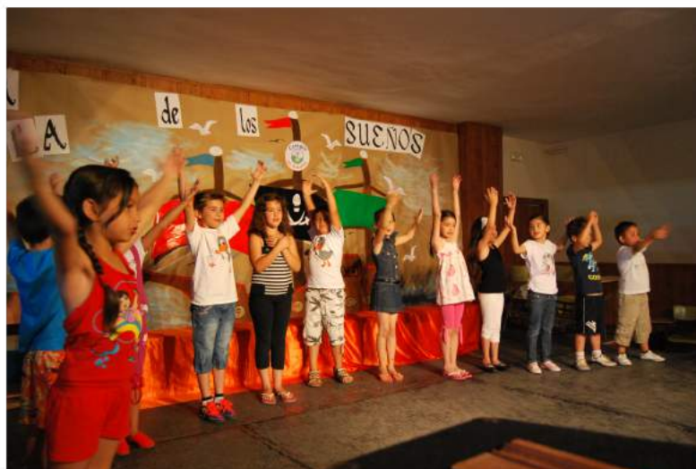
Asamblea de familias y fiesta de la Isla de los sueños

En el mismo año, se creó la comisión gestora y se iniciaron las rondas de consultas para formar las diversas comisiones mixtas.