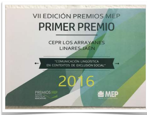
Placa MEP de Primer Premio

Asimismo, el Colegio desarrolla multitud de planes, proyectos y programas para la innovación, todos encaminados al éxito educativo y social de nuestro alumnado. Actualmente son los