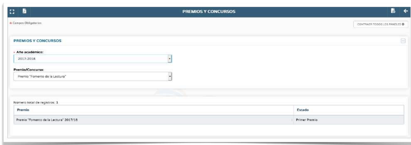
Evidencia de Premio del Centro