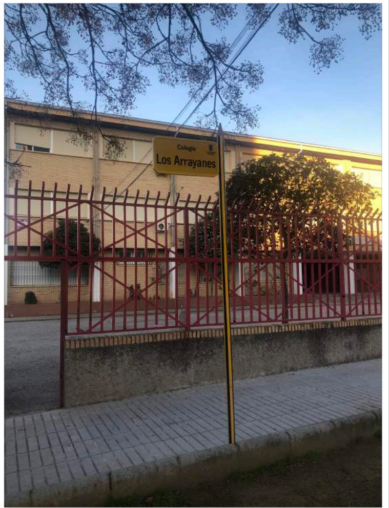
Entrada principal al Centro

4. FAKALI. Comienza su colaboración en este año en curso. El planteamiento es crear vínculos con las familias para trabajar con ellas y desde ellas para una mejor educación de sus descendientes.